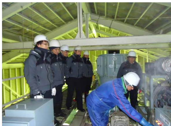
冬期社員等による予備エンジン教育訓練