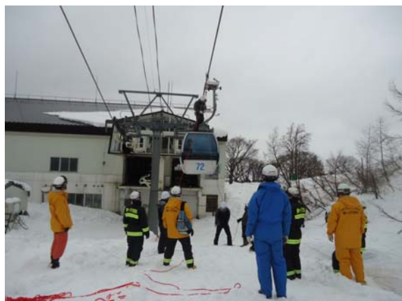
シーズン前の消防署との合同救助訓練