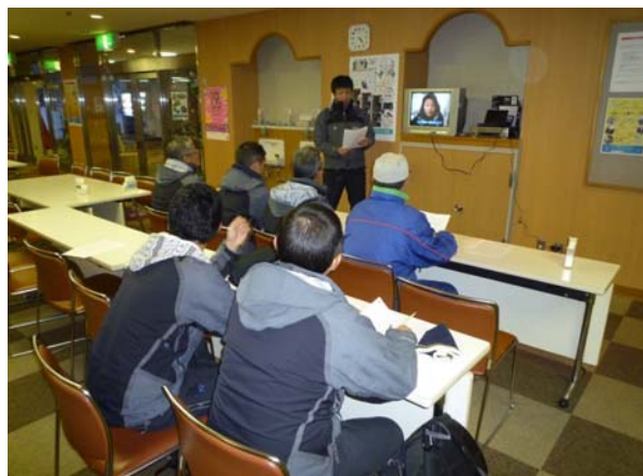
スキーシーズン前のDVDによる講習会