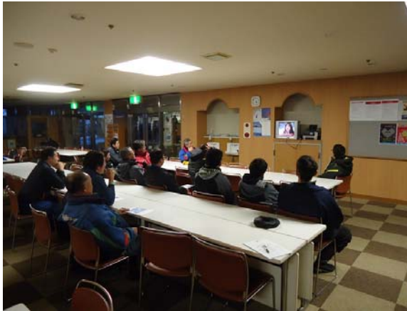
スキーシーズン前のDVDによる講習会