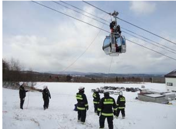
シーズン前の消防署との合同救助訓練