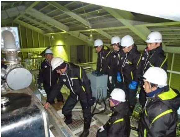
冬期社員等による予備エンジン教育訓練