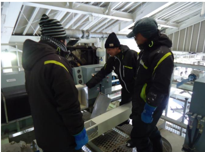
冬期社員等による予備エンジン教育訓練