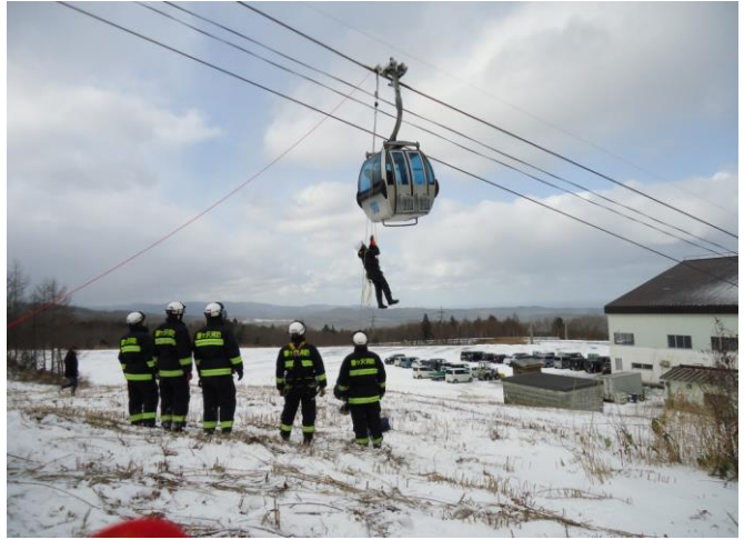
シーズン前の消防署との合同救助訓練