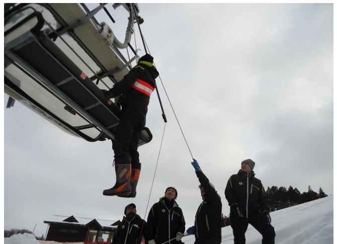
冬期社員等による救助訓練教育訓練