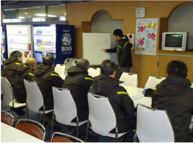
スキーシーズン前のDVD等による講習会