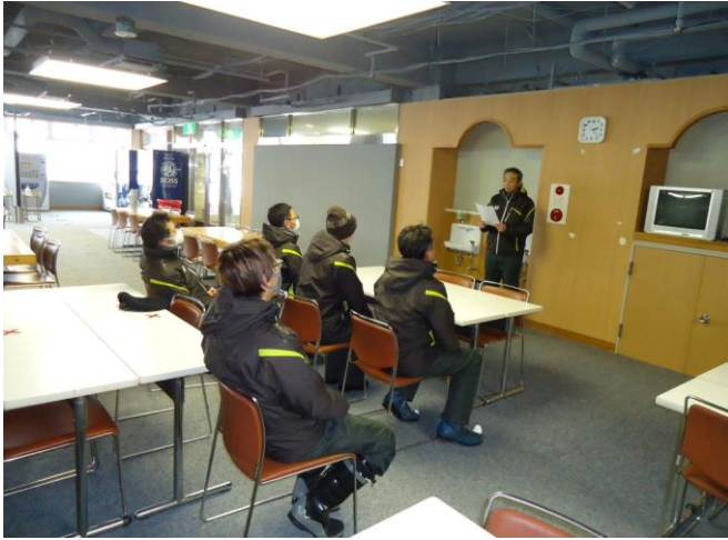
スキーシーズン前のDVD等による講習会 (感染症対策を盛り込む)