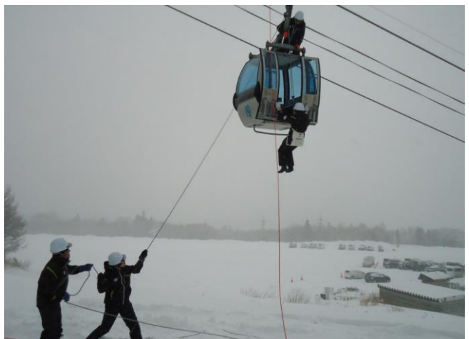
冬期社員等による救助訓練教育訓練