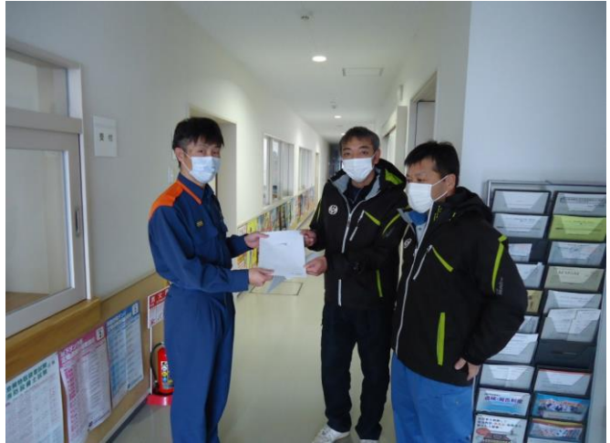
シーズン前の消防署との合同救助訓練 (本年、コロナのため概要書の受渡しのみ)