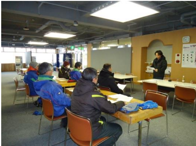
スキーシーズン前のDVD等による講習会