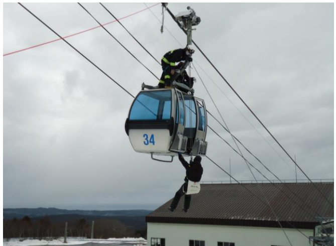
シーズン前の消防署との合同救助訓練