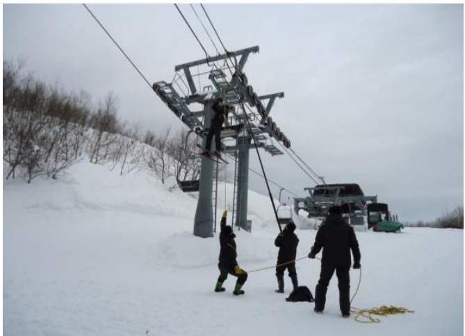
冬期社員等による救助訓練教育訓練