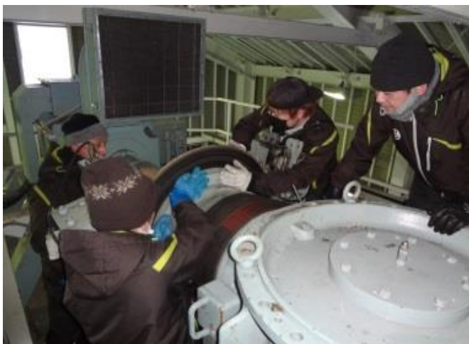
冬期社員等による予備エンジン教育訓練 (切替え手順の説明と実施)