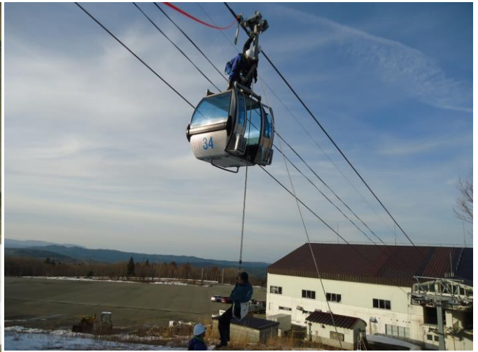
シーズン前の救助訓練 (本年、消防署との合同救助訓練は見送り)