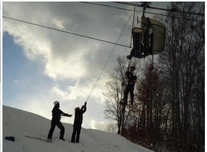
冬期社員等による救助訓練教育訓練