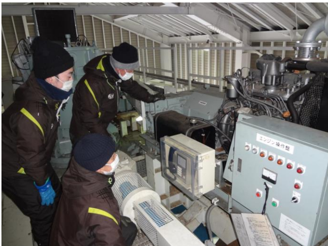
冬期社員等による予備エンジン教育訓練 (切替え手順の説明と実施)