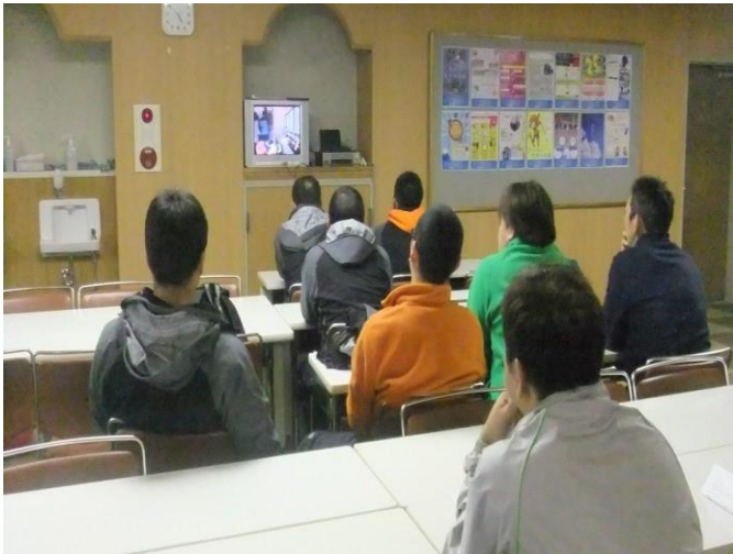
スキーシーズン前のDVD等による講習会